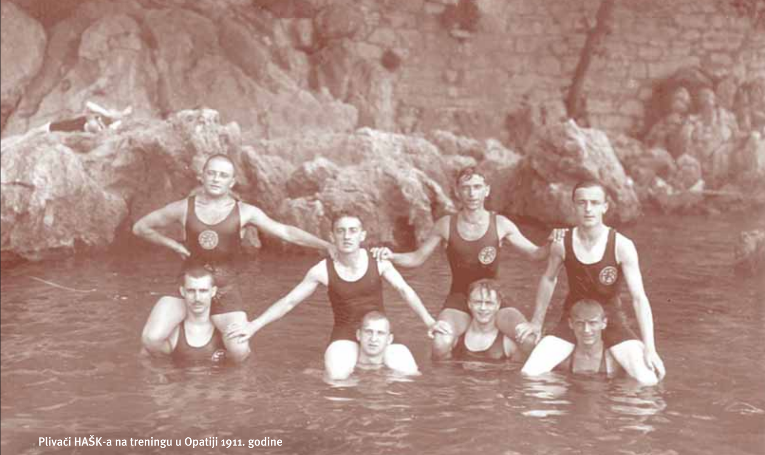
Plivači HAŠK-a na treningu u Opatiji 1911. godine

poznаницa, iako je povjesničar Živko Radan pokušao pronaći taj dokument u arhivu MOO-a.